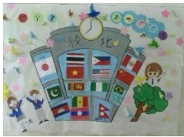
↑国際教室から卒業生へ