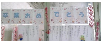
↓図書室から卒業生へ