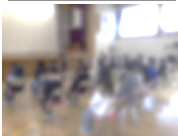
6年 卒業式練習開始