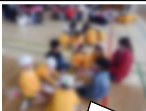
折り紙ふうせんを作ってプレゼントしました