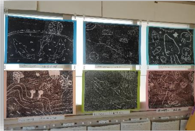
ほった線からはじまるお話（4年生）