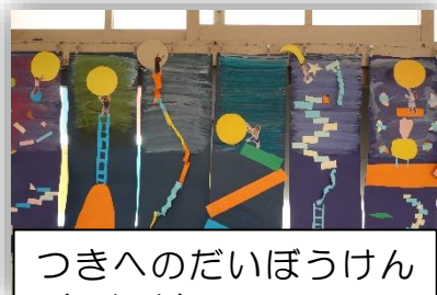
つきへのだいぼうけん（1年生）