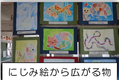
にじみ絵から広がる物語（3年生）