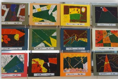
重ねて広がる形と色（5年生）