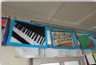
わたしのお気に入りの場所（6年生）