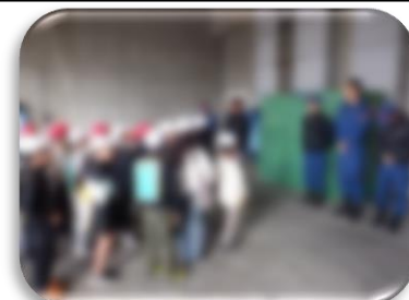
5・6年 他学年に向けての総合的な学習の時間発表