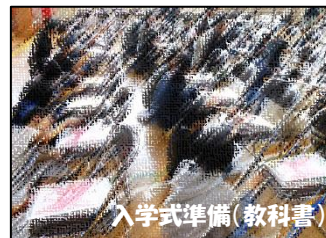
入学式準備(教科書)