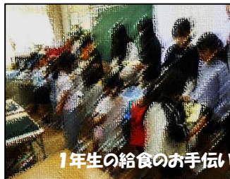
1年生の給食のお手伝い