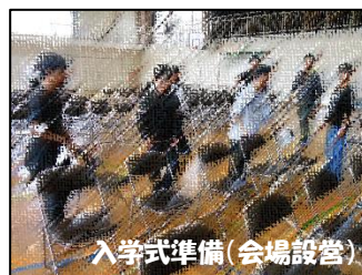
入学式準備(会場設営)

6年生は、1年生が安心して学校生活を送れるよう、多くの場面で気に掛けています。登校時の下駄箱での声かけ、朝の支度の支援、休み時間での関わり、給食の手伝い、牛乳パックの広げ方の説明など、1年生ができること、できるようになることを大切にしながら関わっています。