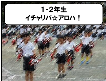
1・2年生 イチャリバ☆アロハ!