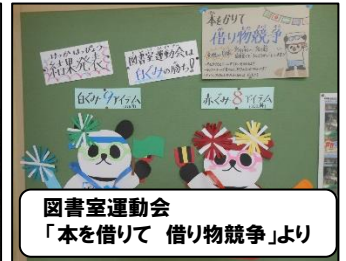
図書室運動会 「本を借りて 借り物競争」より