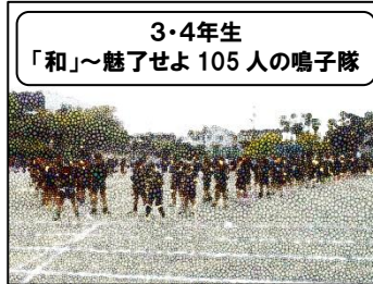
3・4年生 「和」~魅了せよ105人の鳴子隊