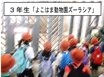
3年生「よこはま動物園ズーラシア」