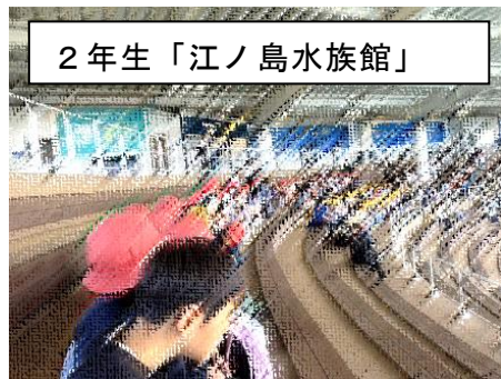
2年生「江ノ島水族館」