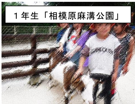
1年生「相模原麻溝公園」