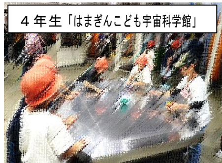
4年生「はまぎんこども宇宙科学館」